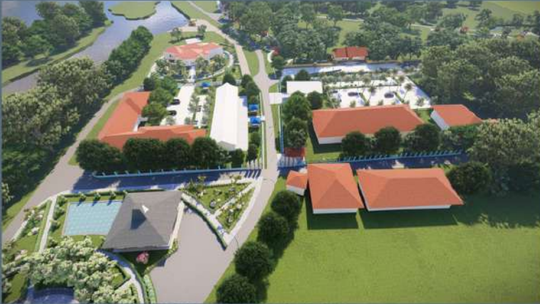
DESAIN LANSEKAP BENDUNGAN SAMPEAN BARU Bondowoso