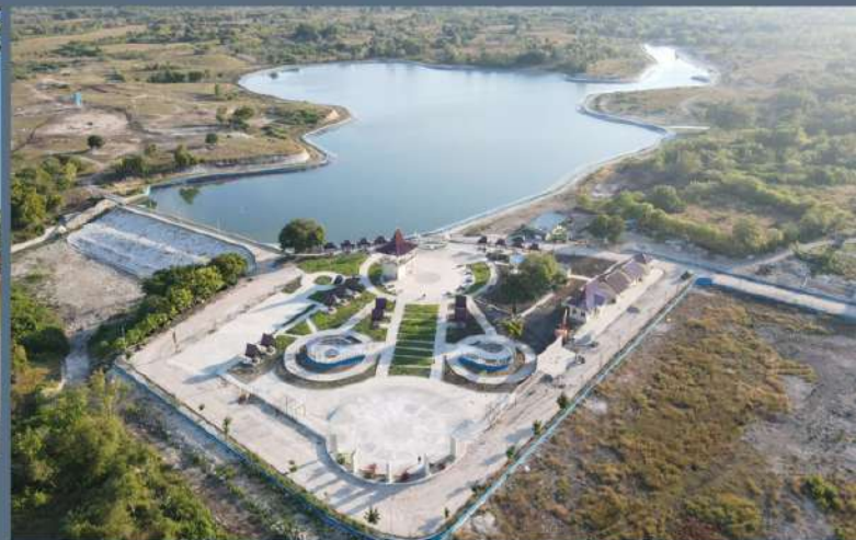
DESAIN LANSEKAP BENDUNGAN KARINGA Sumba Timur NTT