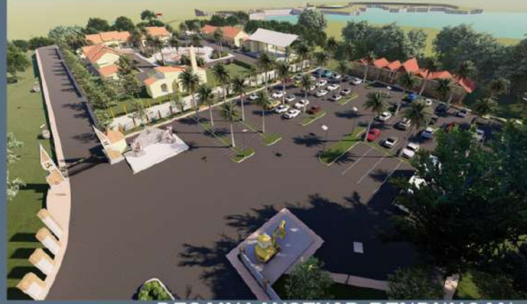
DESAIN LANSEKAP BENDUNGAN BAJULMATI Situbondo