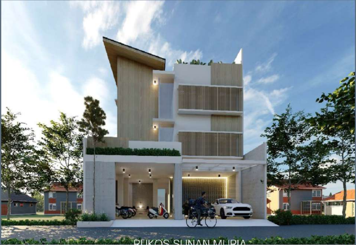
RUKOS SUNAN MURIA