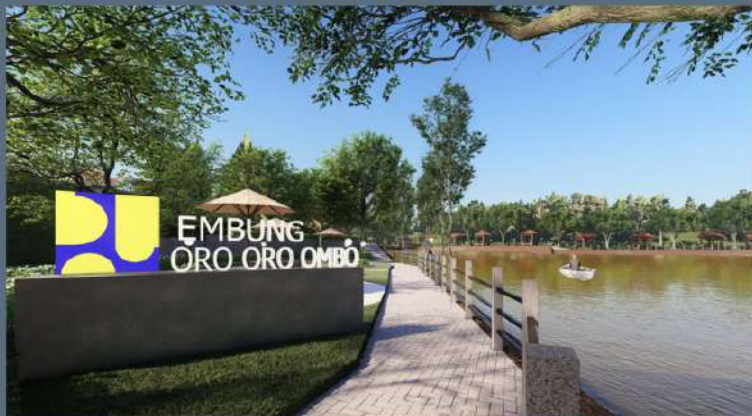
DESAIN LANSEKAP WADUK ORO-ORO OMBO Nganjuk